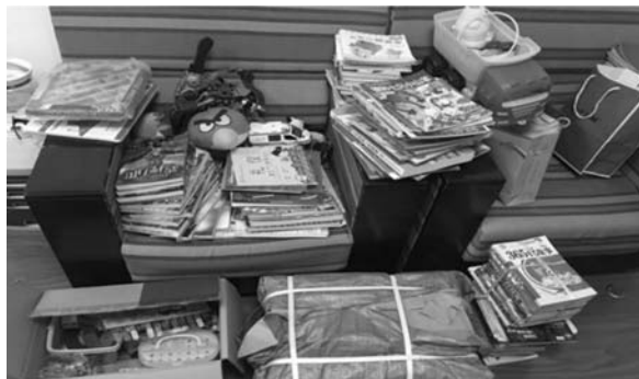
党员捐赠的图书、益智玩具