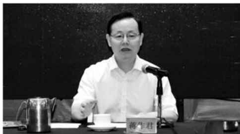
蒋作君出席会议并讲话