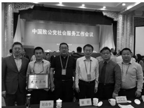
省委出席会议代表合影