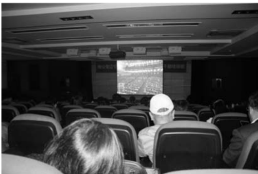
集中收看十九大开幕式