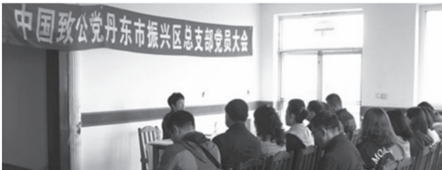
振兴区总支集中学习现场

连日来，丹东市各基层组织，按照致公党丹东市委安排部署，以不同形式深入学习中共十九大精神，读报告、谈体会、话未来，激励党员立足岗位，鼓足干劲，为丹东振兴发展，为实现中共十九大确立的目标任务而努力奋斗！