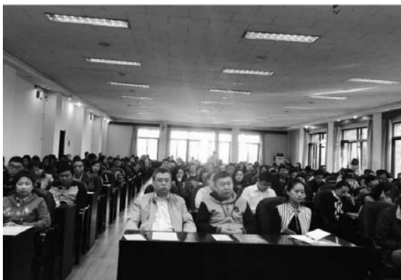
授课现场培训学员认真听课