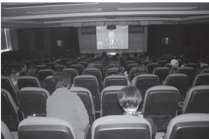
中共十九大开幕式观看现场