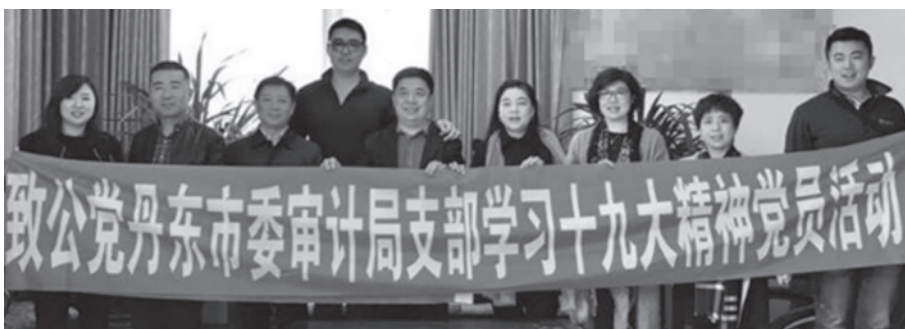
审计局支部学习十九大

10月27日，致公党丹东市审计局支部组织党员学习中共十九大报告，以“矢志跟随、共迎新时代”为主题畅想未来。