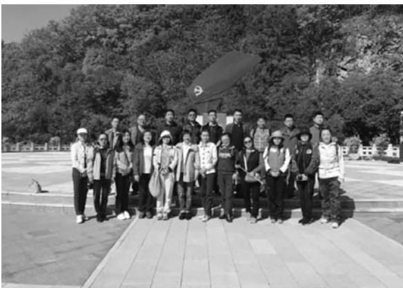
爱国主义教学现场合影