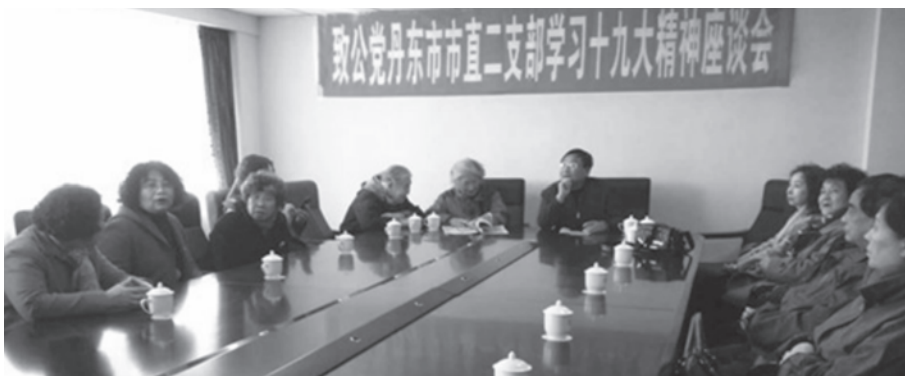
市直二支部座谈会现场

10月30日致公党丹东市直二支部组织召开党员学习中共十九大报告座谈会，研读报告。