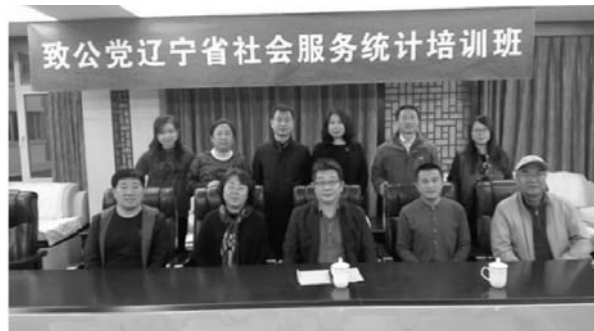
参加培训人员合影