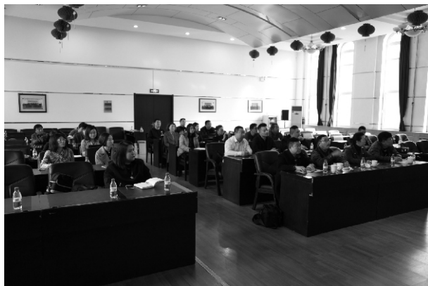
现场学员认真听课