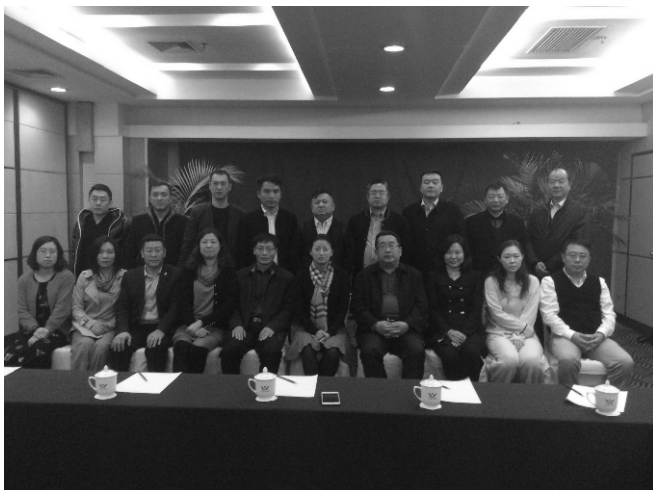
会议人员合影留念