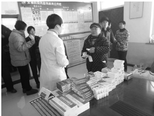
为困难群众分发药品