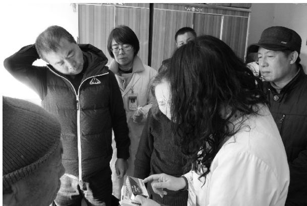
医学专家给帮扶群众讲解药品使用说明