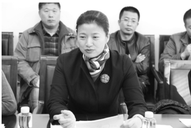
安锦香学习解读十九大报告