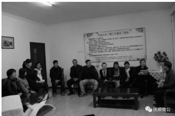
召开专题学习会议